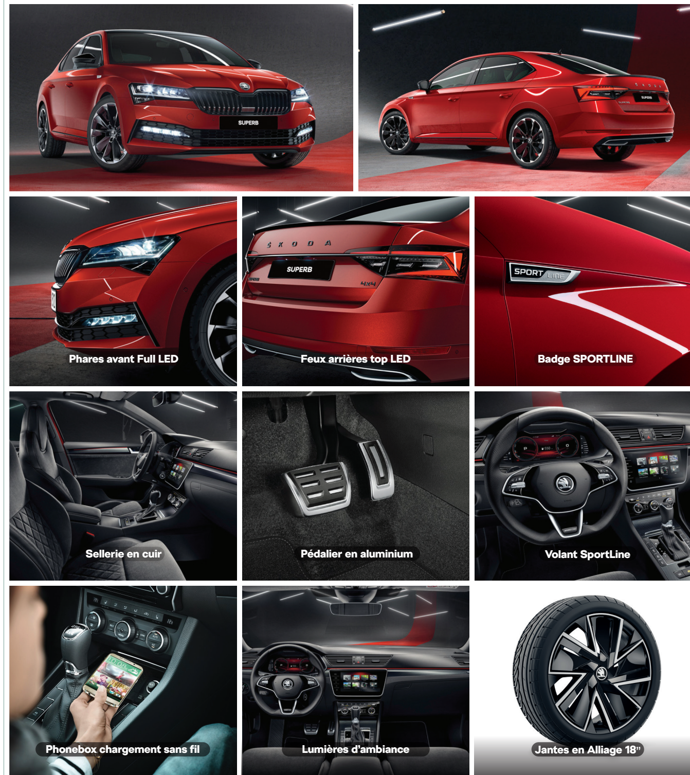
Phares avant Full LED