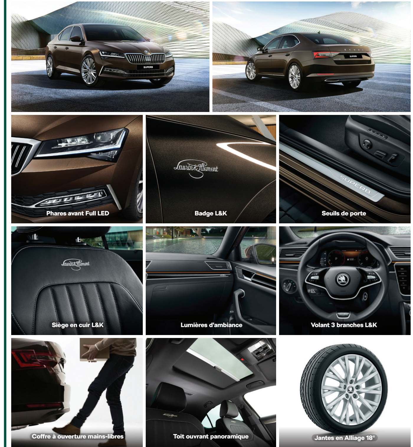
Phares avant Full LED