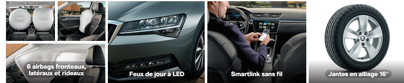
6 airbags frontaux, latéraux et rideaux

1: Antipatinage des roues / 2: Régulation du couple moteur / 3: Freinage multi-collisions / 4: Contrebraquage assisté / 5: Assistance hydraulique au freinage.