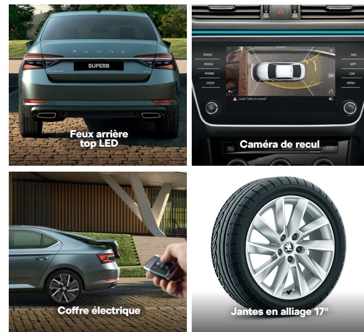
Feux arrière top LED